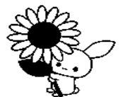
会場 第二道通ビル9F

参加申し込み 会場は定員がありますので参加ご希望の方は 電話&FAX,メールでお申し込みください